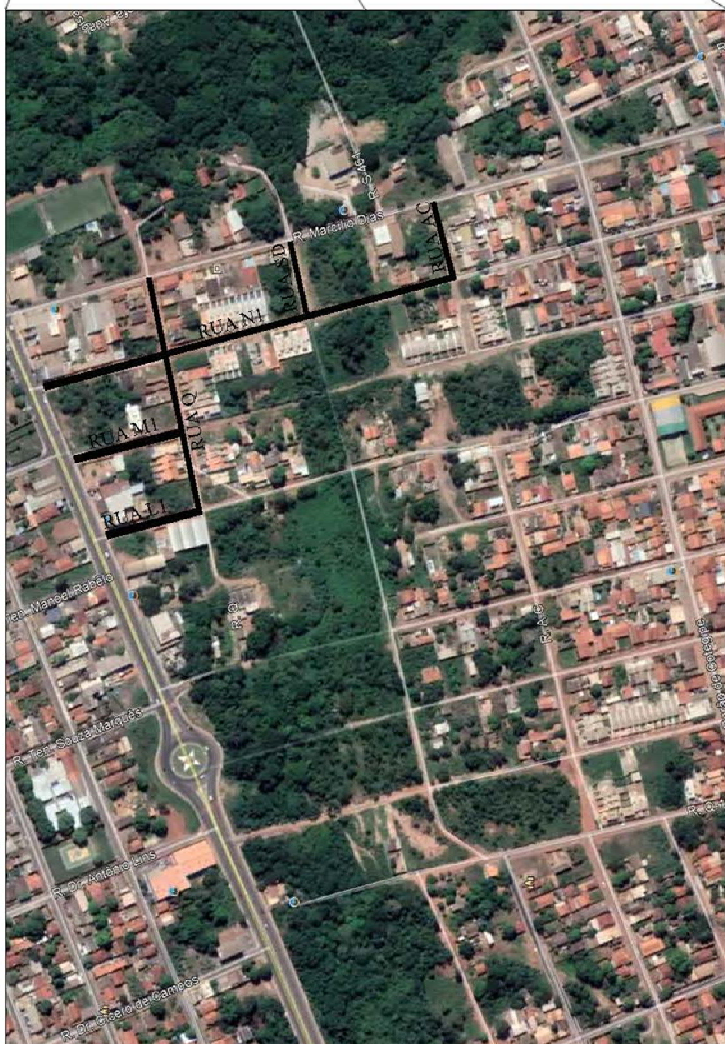
Bairro: Jardim Paula II - Várzea Grande - MT